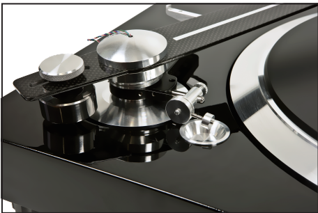
カーボンファイバーの10インチトーンアームによる安定した動作を実現